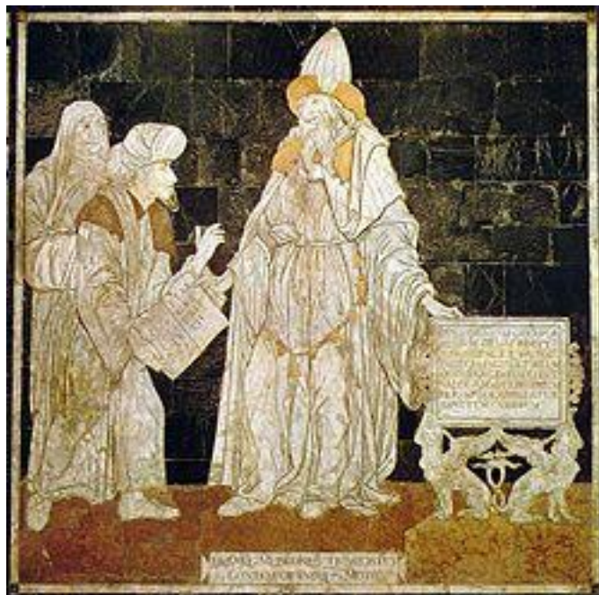
Hermes Trismegistos legt de universele wetten uit Vloermozaïek in de kathedraal van Siena

Ikzelf ken de Renaissance vooral als de tijd waarin de Tarot haar vorm kreeg en de klassieke wetenschappen opnieuw werden ontdekt. Plato en Aristoteles werden afgestoft en de belangstelling voor de oude Egyptische beschaving herleefde. De Tarot hoort thuis in het rijtje van hermetische wetenschappen zoals astrologie, kabbala, alchemie en ik wil graag ook de filosofie aan de reeks toevoegen, want het hermetisme heeft vele vrije geesten voortgebracht die naar hartenlust filosofeerden en speculeerden over de kosmische verhoudingen tussen hemel en aarde en geest en materie. Hun belangrijkste bronnen waren het 'Corpus Hermeticum' en de 'Asclepius' , oude geschriften uit het begin van onze jaartelling waarin de legendarische Hermes Trismegistos kosmische samenhangen uitlegt en een reeks spirituele lessen geeft. Ook voor mij zijn deze twee boeken een belangrijke inspiratiebron geweest. Ik vond er de basisfilosofie waarop de Tarot is gebaseerd. In mijn boek 'De levende Tarot' doe ik verslag van die ontdekkingsreis.